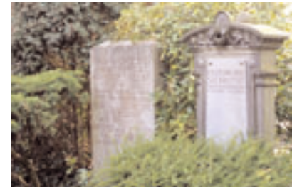
Grabstätte der Familie Siebrecht Fotografie, 2005

Lage, Infrastruktur und Größe garantieren die Zukunft dieses Friedhofs mit seiner einzigartige Tradition. Der alte und Neue St. Nikolai Friedhof dokumentieren auf ihre Weise eindrucksvoll über 700 Jahre hannoverscher Geschichte.