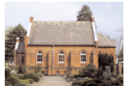
Friedhofskapelle von Hölscher erbaut 1890