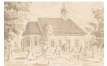
Ansicht der Kapelle nach dem Umbau von 1742/43 Zeichnung um 1860