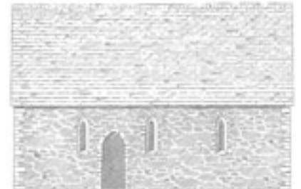
Ansicht der Kapelle im 13. Jahrhundert Rekonstruktionszeichnung von 1952

Im Jahre 1883 erhielt die englische Gemeinde die Genehmigung, das Kirchenschiff um 3,6 m zu verlängern. Das St. Nikolai Hospital trat den dafür benötigten Teil des Friedhofes ab. Die Baumaßnahmen, die bis 1884 andauerten, waren jedoch nur unter der Bedingung genehmigt worden, dass sie nach den Plänen und unter der Leitung von Prof. Conrad Wilhelm Hase (1818-1902), den Begründer der „Hannoverschen Architektenschule“ stattfanden. Im Zuge dieser Erweiterung wurde die St. Nikolai Kapelle von Hase restauriert. Dabei riss man auch den sogenannte „Klus“ ab, ein baufälliger Anbau an der Südseite, der vermutlich aus dem 15. Jahrhundert stammte. Im Klus bewahrte der Totengräber früher seine Gerätschaften und die Leichen auf.