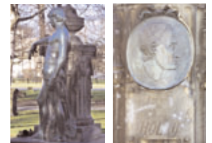
Grabdenkmal für L. C. H. Hölty Fotografie, 2005