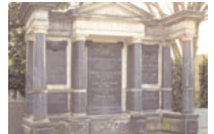
Grabstätte der Familie Kraul Fotografie, 2005

Im Jahre 1890 gestatteten es die Finanzen des St. Nikolai Stiftes am Kreuzungspunkt der beiden Hauptachsen des Friedhofes nach Plänen des Architekten Hölscher eine Kapelle mit Leichenhalle, die sich stilistisch an die Backsteingotik anlehnte, zu erbauen.