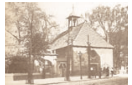
Ansicht der Kapelle nach der Restaurierung 1883/84 Fotografie um 1930