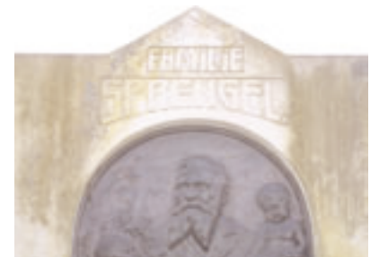
Grabstätte der Familie Sprengel (Ausschnitt) Fotografie, 2005