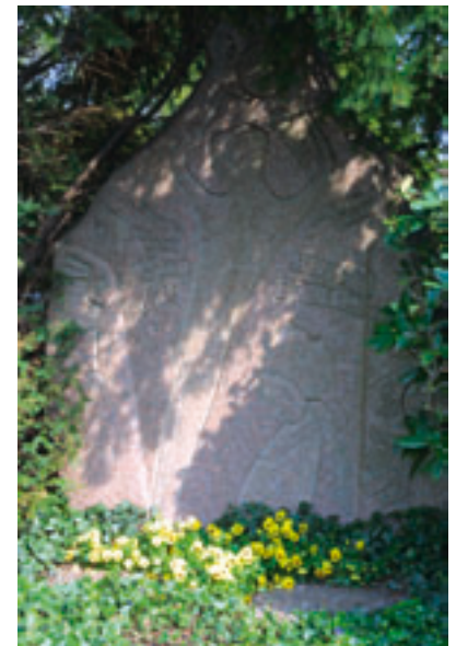
Grabstätte der Familie Bahlsen Fotografie, 2005