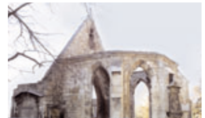
Ruine der Kapelle - heutiger Zustand Fotografie, 2005

In der Bombennacht vom 8. auf den 9. Oktober 1943 wurde die Nikolaikapelle stark zerstört; es blieben nur der Chor, der sich anschließende Giebel des Langhauses mit dem Triumphbogen und die seitlichen Wände des Schiffes stehen. Diese Seitenmauern wurden 1953 im Zuge der Verbreiterung der Goseriade größtenteils abgerissen. Übrig blieb nur die Ruine in ihrer heutigen Form.