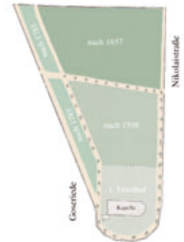
2. bis 4. Erweiterung des St. Nikolai Friedhofes, Rekonstruktion

Auch der alte Friedhof wurde durch die Bombardierungen Hannovers in Mitleidenschaft gezogen. Einschneidender waren jedoch die Baumaßnahmen der Nachkriegszeit: Aufgrund der Verbreiterung der Goseriede und des Durchbruches der Celler Straße im Jahre 1953 sind nur noch zwei kleine Restflächen mit einigen Grabsteinen übrig geblieben.